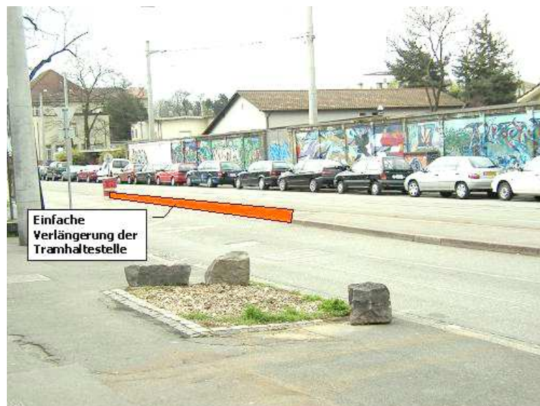
Bild Verlängerung der Traminsel bis zum heutigen provisorischen Verkehrsteiler (Fass)